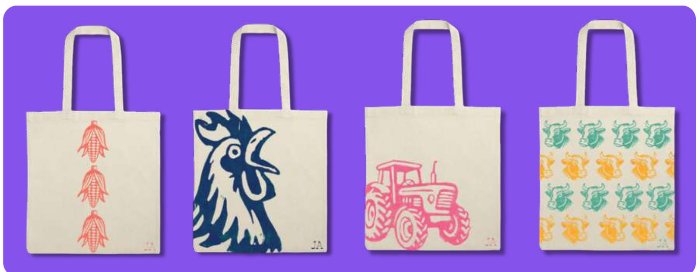
Exemple de travail d'élève - Création d'illustrations en linogravure sur sac pour le festival des agriculteurs